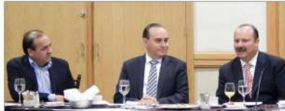
La reunión se celebró en el recinto de Expo Chihuahua y fue presidida por el Gobernador y el Alcalde de Chihuahua, y por el Secretario General de FENAMM.