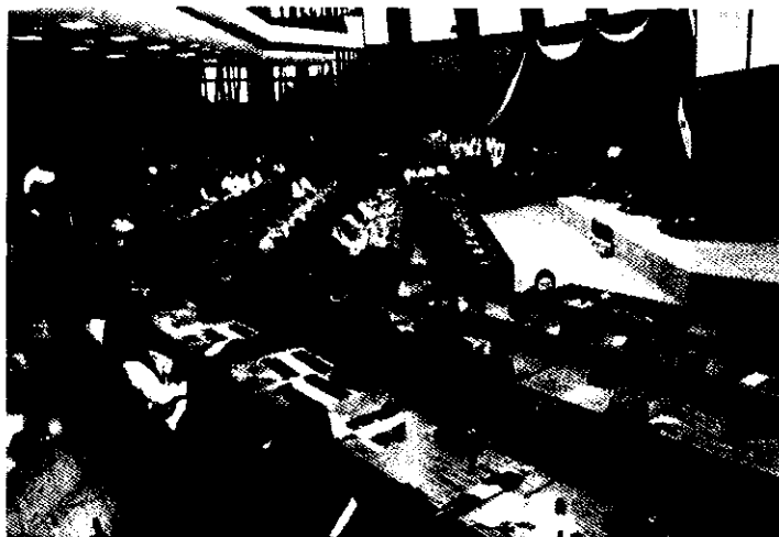
El evento se realizará en la Sala Bicameral del Congreso Nacional.

El Foro "Presupuesto Público para la buena gobernanza, sus alcances y limitaciones" se realizará el miércoles 11 de diciembre, de 8.00 a 12.00 horas, en la Sala Bicameral del Congreso Nacional. Es organizado por la Florida International University de Miami, la Universidad Nacional de Asunción (UNA) y la Organización No Gubernamental COPLANEA y cuenta con el apoyo del Senado.