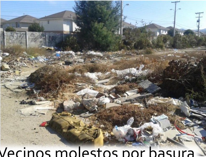
Vecinos molestos por basura en sitios Privados