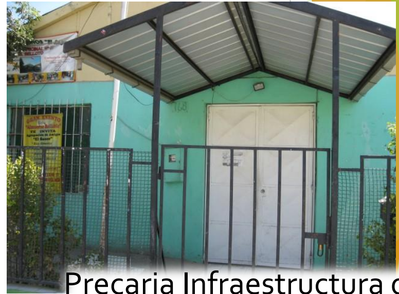
Precaria Infraestructura de Sede Social