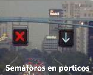
Semáforos en pórticos