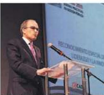
LIDER EMPRESARIAL. Placa por el tercer día que es importante que se establezca un vínculo con el Estado y los organismos públicos.