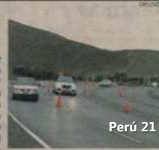
> Se aplica en cerro Centinela.

El plan vial Carril Reversible, que aplica el municipio de La Molina en el cerro Centinela, fue premiado por la organización Ciudadanos al Día. La iniciativa, que consiste en utilizar un tercer carril de La Molina a Surco en horas punta, ha logrado reducir de 40 a 17 minutos lo que tomaba salir del distrito. Además, se logró disminuir en 50% la emisión de gases tóxicos.