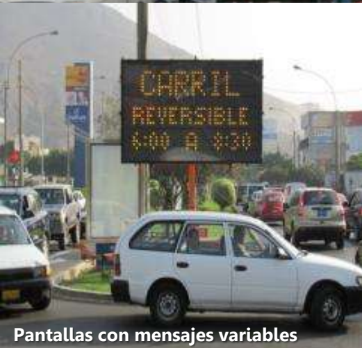
Pantallas con mensajes variables