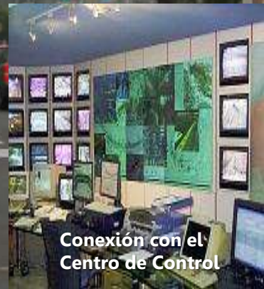
Conexión con el Centro de Control