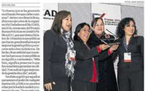
EMPRENDEDORES. Premio Fundador otorgado del segundo día que como emprendedoras en la Presidencia del Consejo de Ministros.