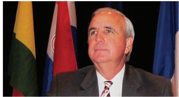
Alcalde Carlos Gimenez

El Plan de Acción de la Declaración de la Cumbre Hemisférica de Quebec, Canadá (2001), por ejemplo, incluyó entre sus documentos de base la Declaración de la VI Conferencia Interamericana de Alcaldes y Autoridades Locales, y compromete en el mismo a las autoridades nacionales a que “considerarán detenidamente las recomendaciones de la Sexta Conferencia Interamericana de Alcaldes, y otros procesos relevantes”.